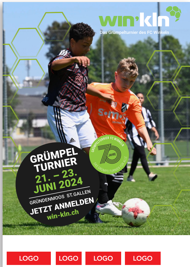
Plakate A3 / Strassenblachen 1300 x 1300